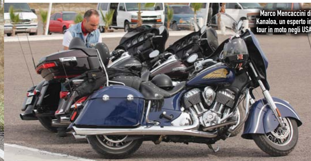
Marco Mencaccini di Kanaloa, un esperto in tour in moto negli USA