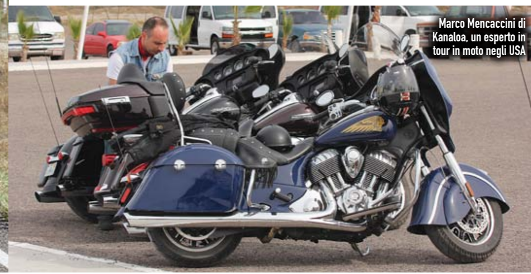
Marco Mencaccini di Kanaloa, un esperto in tour in moto negli USA