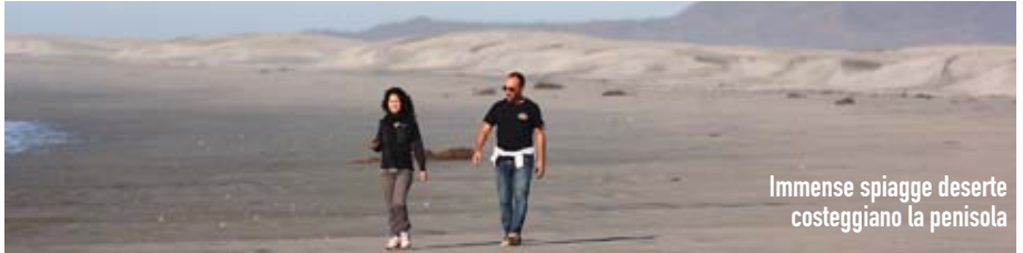
Immensi spiagge deserte costeggiano la penisola