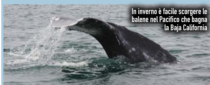
In inverno è facile scorgere le balene nel Pacifico che bagna la Baja California

del dia o le fajitas mi ristorano. La Paz, Loreto, Todos Santos, le bettole accompagnate da "zio Jack"... Il viaggio è incredibile, forse più avanti incontreremo Zorro! Ensenada, giorno dell'equinozio. Al