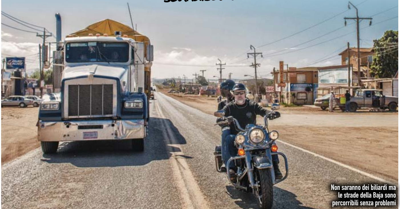
Non saranno dei biliardi ma le strade della Baja sono percorribili senza problemi