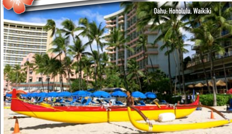
Oahu: Honolulu, Waikiki