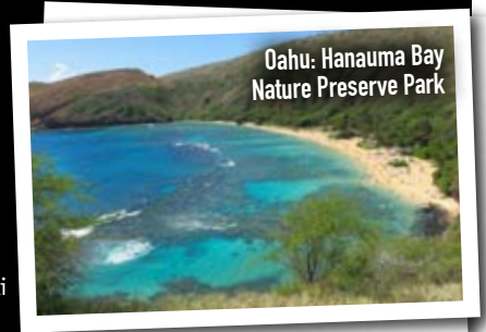
Oahu: Hanauma Bay Nature Preserve Park

nessuna foto potrà mai esprimere completamente, ma la nostra mente non potrà mai cancellare.