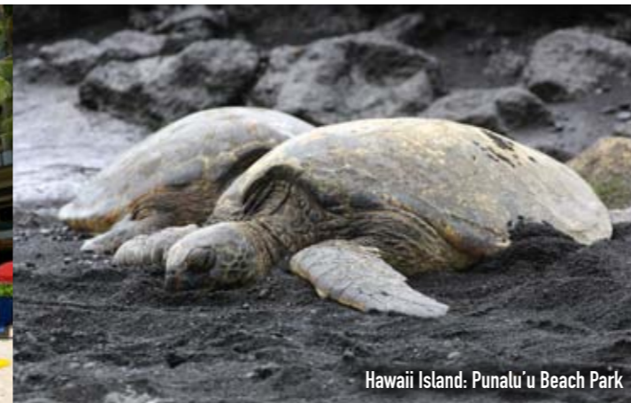
Hawaii Island: Punalu'u Beach Park