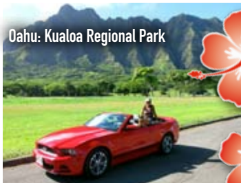
Oahu: Kualoa Regional Park