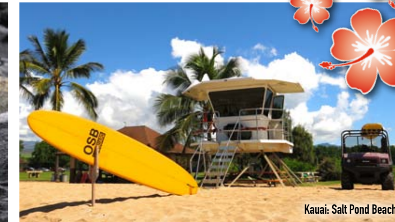
Kauai: Salt Pond Beach